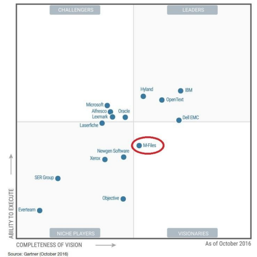
Figure 1. Magic Quadrant for Enterprise Content Management

Depuis 2016, M-Files est l'une des solutions « visionnaires » mises en avant par Gartner